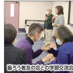
盲ろう者友の会との学習交流会