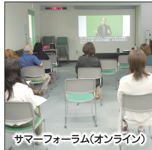
サマーフォーラム(オンライン)

手話にかかわる医療現場を考える 盲ろう者のくらしと通訳介助員の活動を考える 医療班(体音計) 通介班