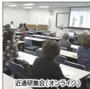
近通研集会(オンライン)