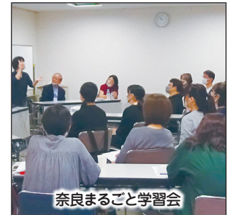
奈良まるごと学習会